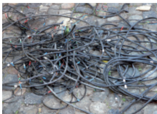
JULIEN NICOLAS, France Sans titre 2008, photographie couleur 66 x 88 cm. Etudiant aux Beaux-Arts de Toulouse, crée un espace chantier in progress à partir du lieu de l'école en travaux et celui de ses propres recherches.