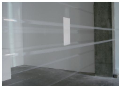
FERNANDA GOMEZ, Brésil Sans titre 2006, 480 x 130 x 230 cm. L'espace est investi sur un mode poétique avec mise en résonance des matériaux aux densités et opacités variables, papiers, adhésifs, pierre...