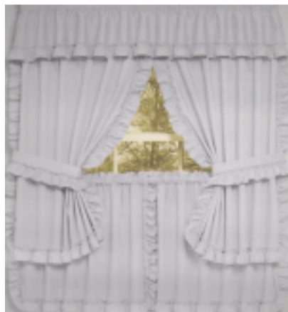
ERNST CARMELLE, Autriche Anonymous image 1 Sérigraphie, 100 x 70 cm. Les rideaux d'une fenêtre, un espace composite recomposé à partir d'éléments anonymes.