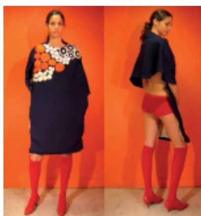
EUNG-BEOM SIM, Corée Robe sur mannequin 2007, pièce "face-dos" contradictoire, modèle à l'avant enveloppant et sage pour mieux dénuder l'arrière et révéler jambes et petite culotte.