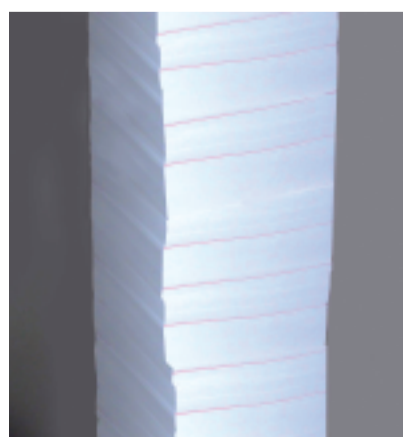
ANNE DEGUELLE, France Colonne sans fin 2008, sculpture, 250 x 21 x 29,7 cm une reprise de la colonne de Brancusi à l'aide d'un standard planétaire, les rames de papier A4.