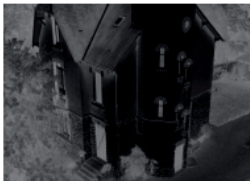
REMY MARLOT, France Black Houses 2006, photographie 108 x 85 cm, 5 ex. Image en négatif, vue plongeante, image cinématographique de la boîte noire de notre mémoire.